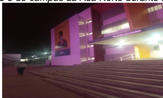
Figura 3 - Fotografia do bloco 3 do campus da Asa Norte durante a Campanha Outubro Rosa.

A proposta de identidade visual foi aprovada, e a estrutura necessária para registro de voluntários e de entidades foi desenvolvida com o objetivo de agregar valor à marca UniCEUB e associar o compromisso de incentivar a cultura de voluntariado como imagem positiva, inclusive, para demonstrar aos potenciais clientes a responsabilidade social institucional. A divulgação das atividades e das campanhas agrega valor à imagem institucional. Um exemplo é a iluminação dos prédios dos campi na cor rosa, durante a campanha Outubro Rosa.