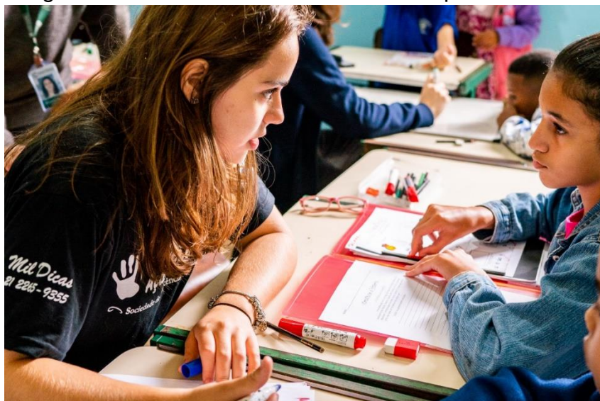
Imagem 01 – Alunos durante atividade de apoio escolar