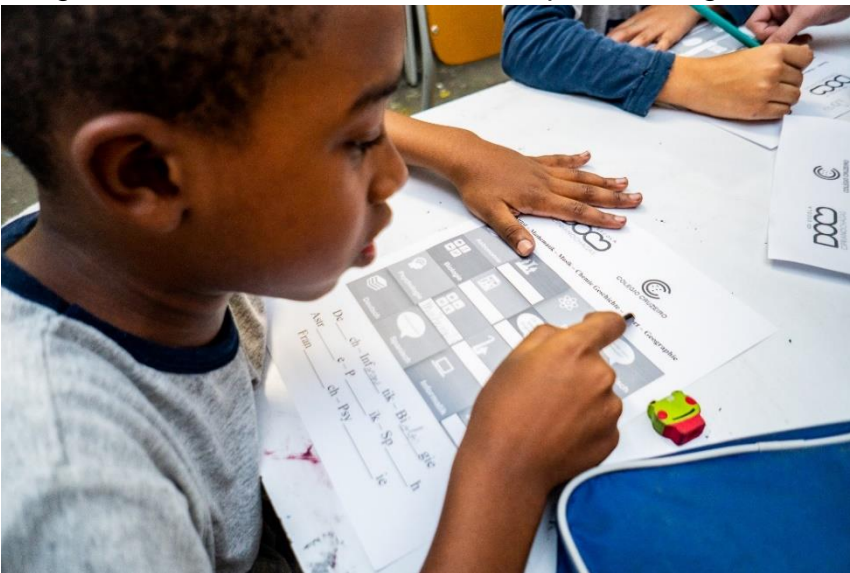
Imagem 05 – Alunos da Escola Dom Cipriano Chagas durante ensino de língua alemã INPAR