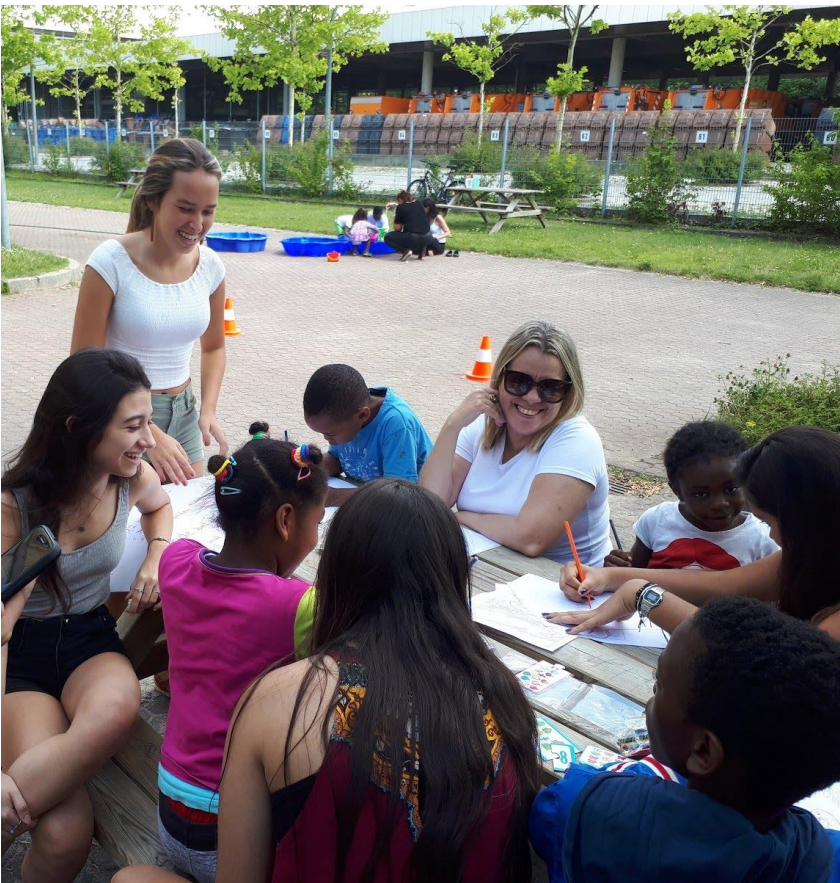
Imagem 07 – Alunos do Colégio Cruzeiro durante apoio escolar em Viagem de Estudos na Alemanha para crianças refugiadas.